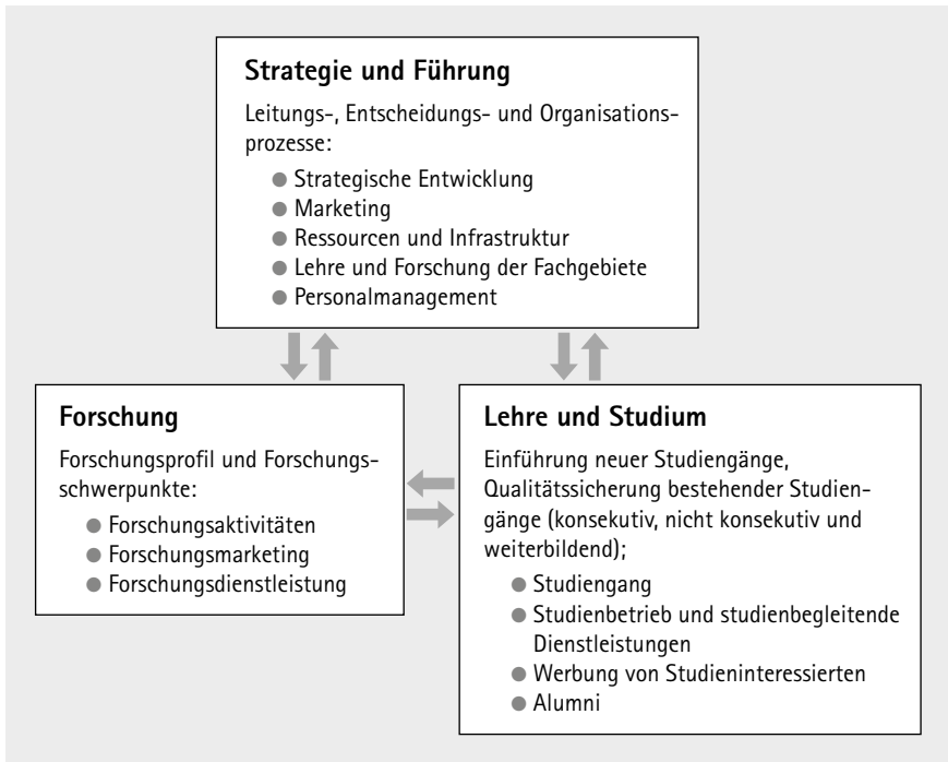
Abbildung 1: Kernbereiche des Qualitätsmanagementsystems

Strategie und Führung beinhaltet die zielorientierte Steuerung der Universität. Die zugeordneten Prozesse sind inhaltlich unterlegt: