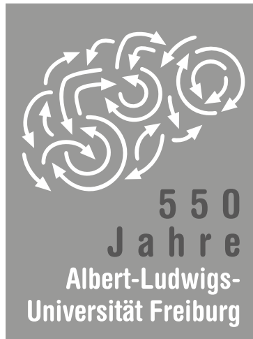
Abbildung 1: Jubiläumslogo

Um diesen Aufbruch zu symbolisieren, wurde das Jubiläum durch ein eigenes Logo visualisiert. Dynamik, Vitalität, Vernetzung und gegenseitige Durchdringung der Disziplinen, aber auch Öffnung nach außen sind Eigenschaften, welche die moderne Universität auszeichnen und durch die bewegten Pfeile zum Ausdruck gebracht wurden; wesentliche Werte des universitären Alltags wie Geist, Wissen, Intuition, Erfindungsgabe in Forschung, Lehre und Bildung spiegeln sich in der Andeutung eines Gehirns. Der Anlass des Ereignisses – 550 Jahre Albert-Ludwigs-Universität – erschließt sich dem aufmerksamen Betrachter aus dem Gesamtbild der bewegten Pfeile.