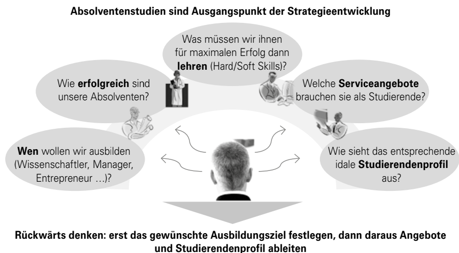
Abbildung 2: Bedeutung von Absolventenstudien für die hochschulische Strategieentwicklung

Vor dem Hintergrund der einleitenden Ausführungen zu Faktoren, die den Rekrutierungswettbewerb verschärfen, wird deutlich, dass eine reine Fokussierung der Hochschulen auf die eigenen Absolventinnen und Absolventen zu kurz greift. Wenn die Hochschulen ihre Studierendenzahlen über das sich aufbauende Nachfragehoch hinaus halten wollen, müssen sie ihren räumlichen Fokus erweitern. Der Rekrutierungswettbewerb kann somit nicht länger auf die eigene Region bzw. traditionelle „Einzugsgebiete“ beschränkt bleiben, sondern muss zwangsläufig auf die nationale bzw. inter-